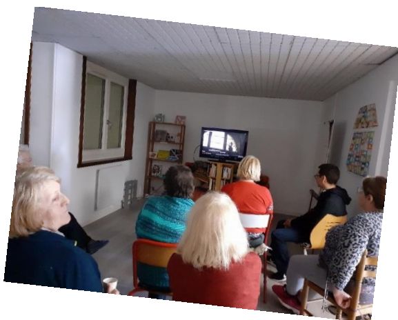
Présentation du film documentaire « En suivant la statue perdue »