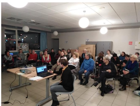
Soirée de COPIL