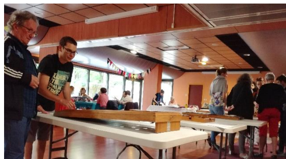
Rencontre Nationale : le 6 juin, une 40ne d'adhérents ont eu l'occasion de se rencontrer à Aix-les-bains